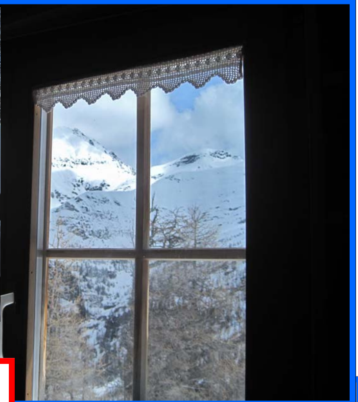
Dentro e fuori la capanna Buffalora