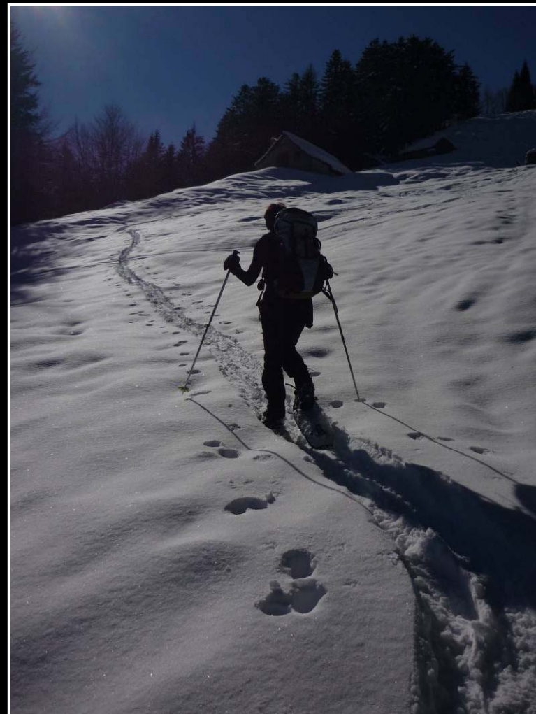
L'alpe Provaccio; la neve aumenta