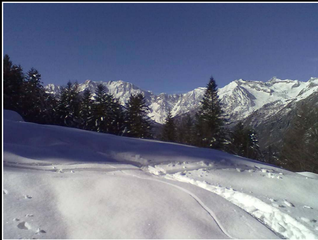
Il Monte Rosa dietro agli abeti