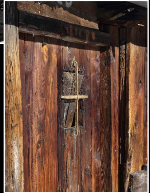
La prima neve che si incontra è a Balmo. Le baite.