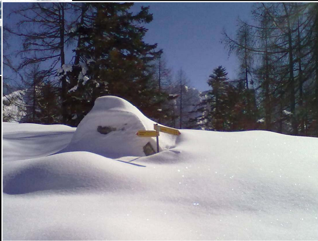
La neve non manca....