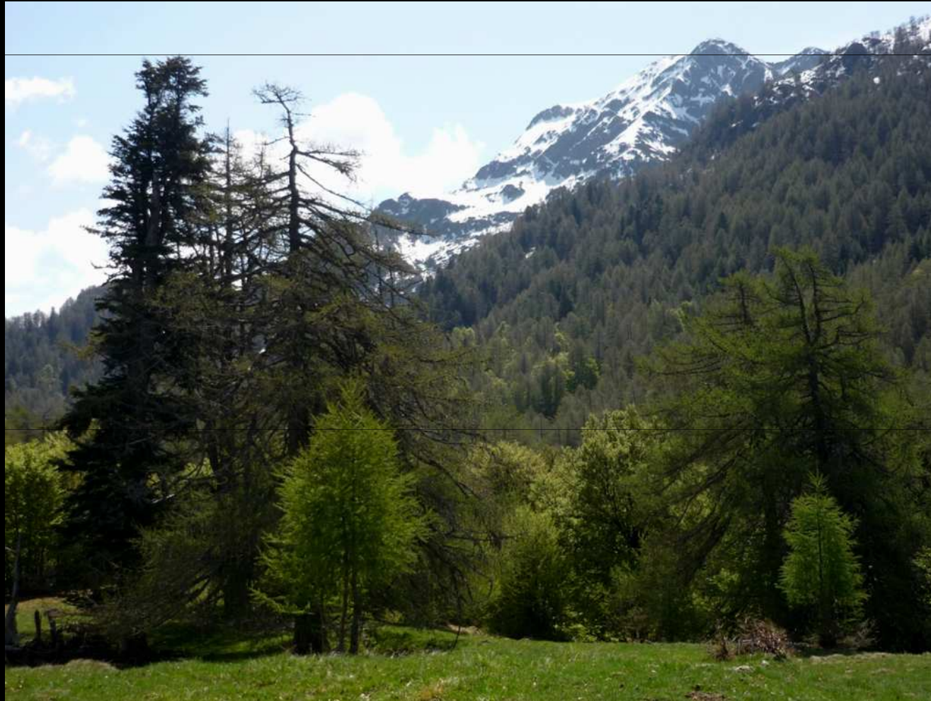
Come si presenta il versante Nord del Camoghè, nostro percorso di salita

Il sopralluogo aveva soprattutto lo scopo di conoscere le condizioni del pendio nord, e dobbiamo dire che se nei prossimi giorni non farà un pò più caldo, sarà davvero difficile andare in vetta.