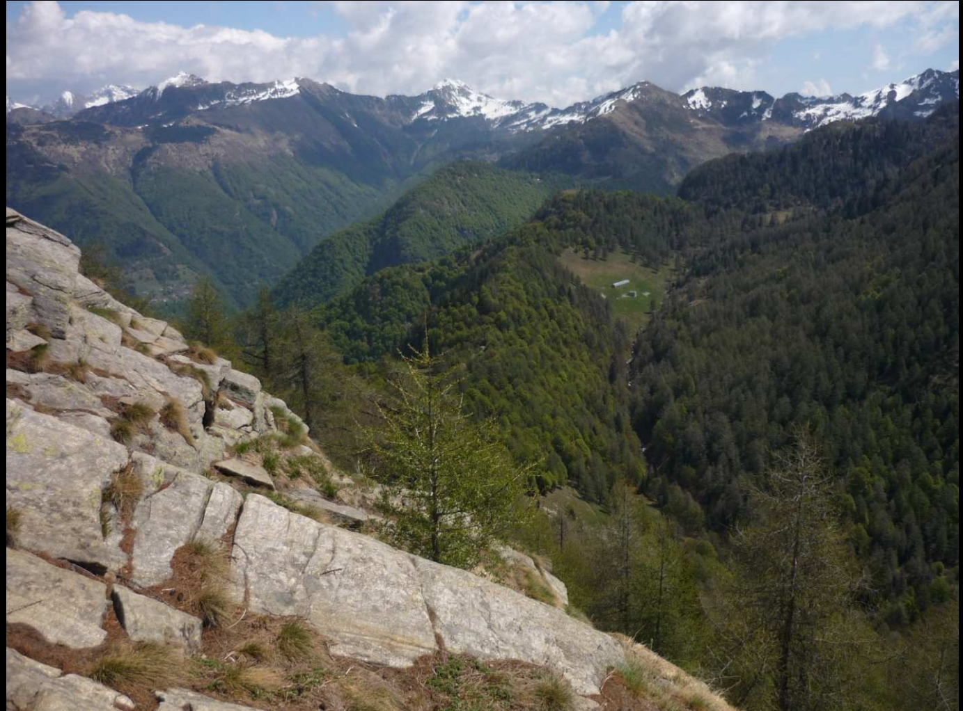
Corte di Mezzo, punto di arrivo del nostro sopralluogo, visto dal Pizzo di Corgella

Ricordiamo che, dopo Corte di Mezzo, si tratta di una salita EE e il dislivello sarà di 1176 mt .