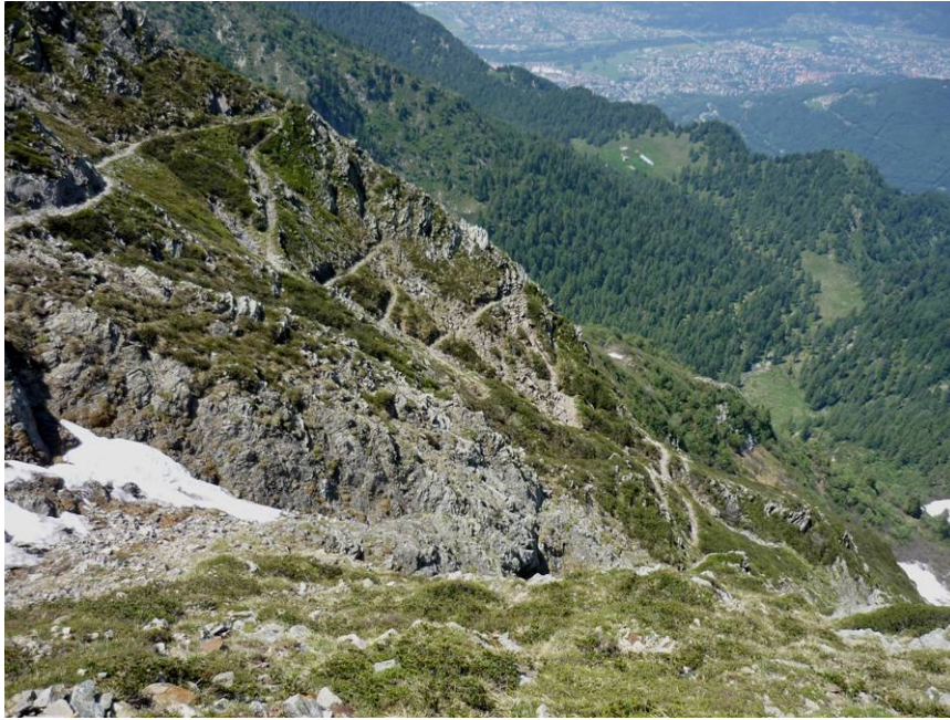
Il sentiero sul costone roccioso. In fondo l'alpe Corte di Mezzo e oltre, Bellinzona

Si volta a destra in direz SO per attraversare in salita la conca sotto la bastionata ed andare a prendere il sentiero che inizia un tortuoso zigzag su un ripido costone roccioso; il sentiero è a spesso esposto, occorre un passo sicuro. Nell'ultimo tratto il sentiero, sempre ripido, rientra nella conca sotto la vetta.