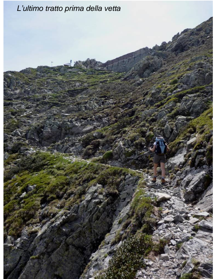
L'ultimo tratto prima della vetta

Discesa per lo stesso itinerario, ma non si esclude la possibilità, qualora vi siano le condizioni, di effettuare una variante.