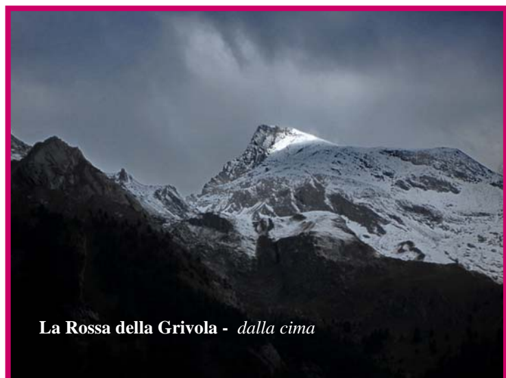
La Rossa della Grivola - dalla cima

In caso di problemi "oggettivi", la Valle offre comunque tante alternative possibili. Certamente possiamo fare salvo il problema della frequente presenza di vipere indigene. ( Per quelle al seguito non possiamo garantirle ).