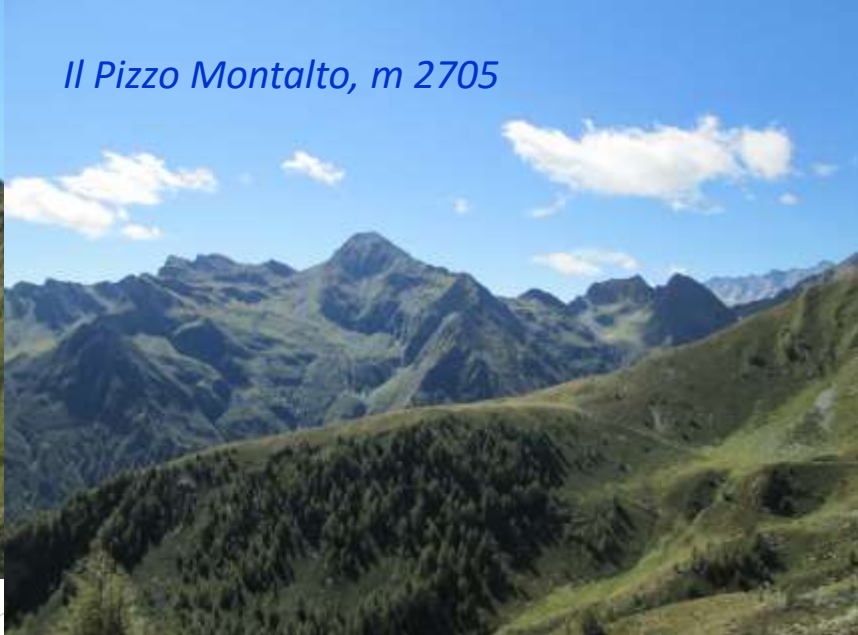
Il Pizzo Montalto, m 2705