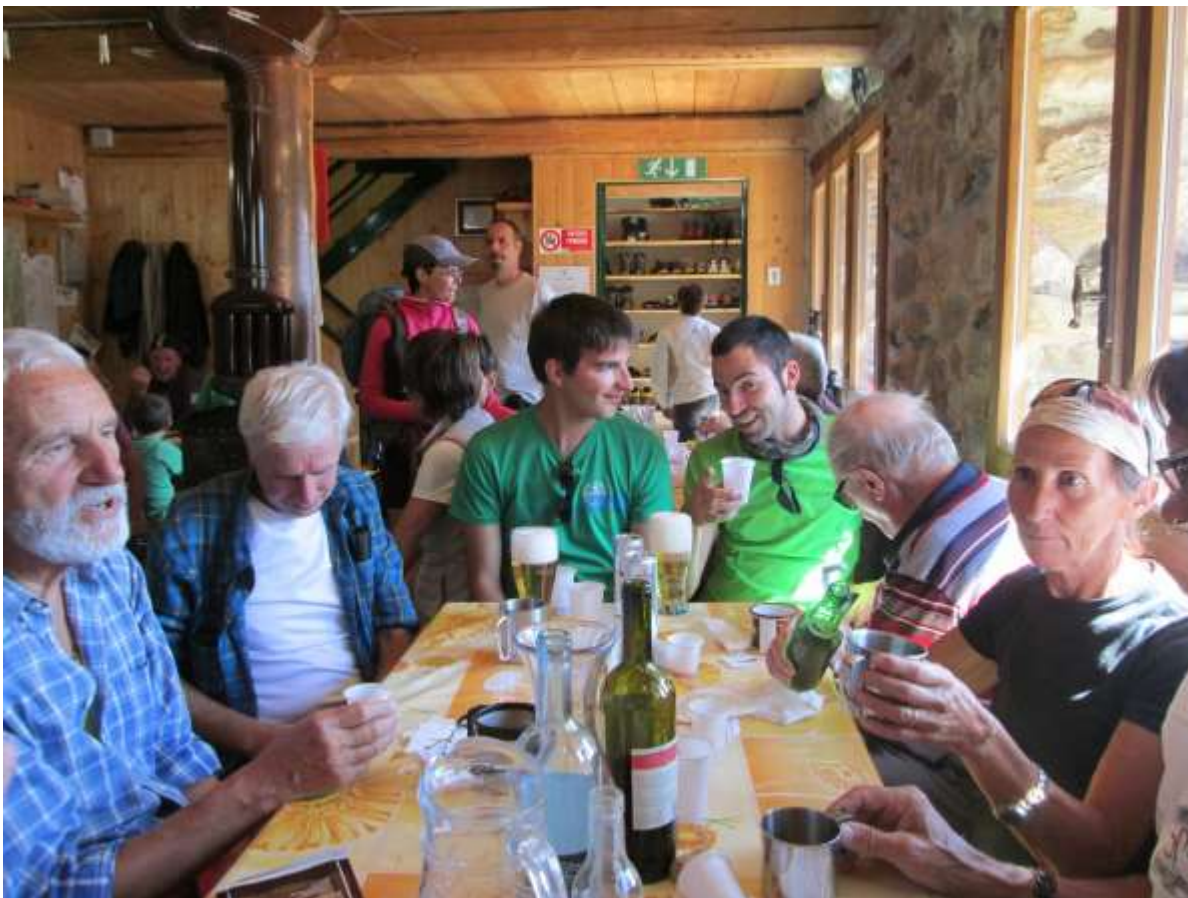
Pranzo al Rifugio