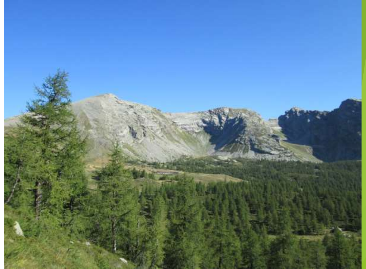
Vista verso il Pizzo Pioltone m 2612