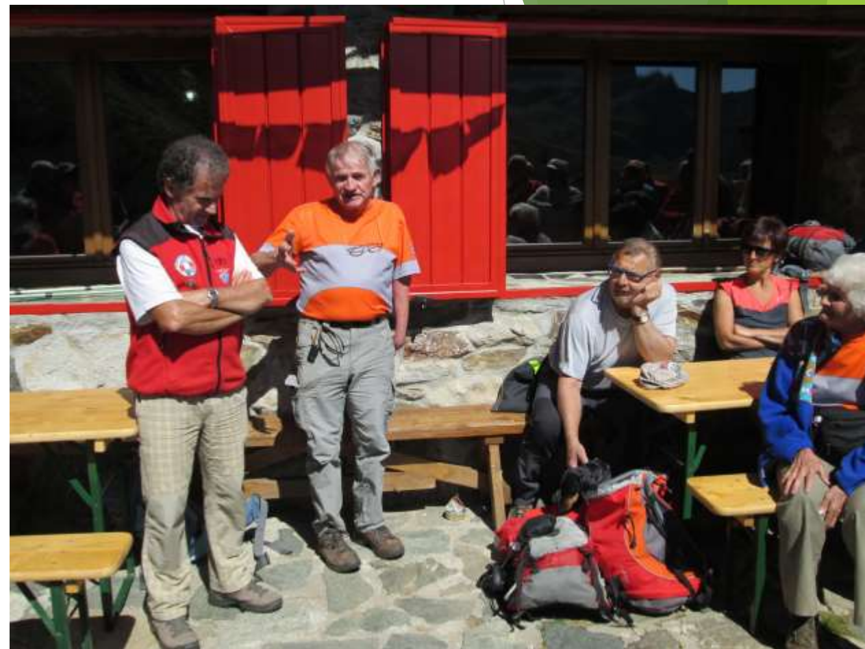
Discorso delle autorità in occasione dell'incontro intersezionale all'Alpe Laghetto