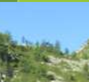
Poco dopo raggiungiamo il lago di Ragozza, m 1958, nei pressi del Rifugio Gattascosa.