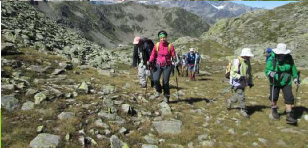
Arrivo alla Bocchetta di Oriaccia, m 2326