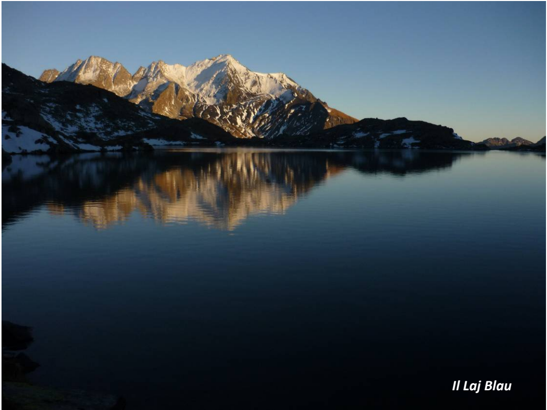
Il Laj Blau