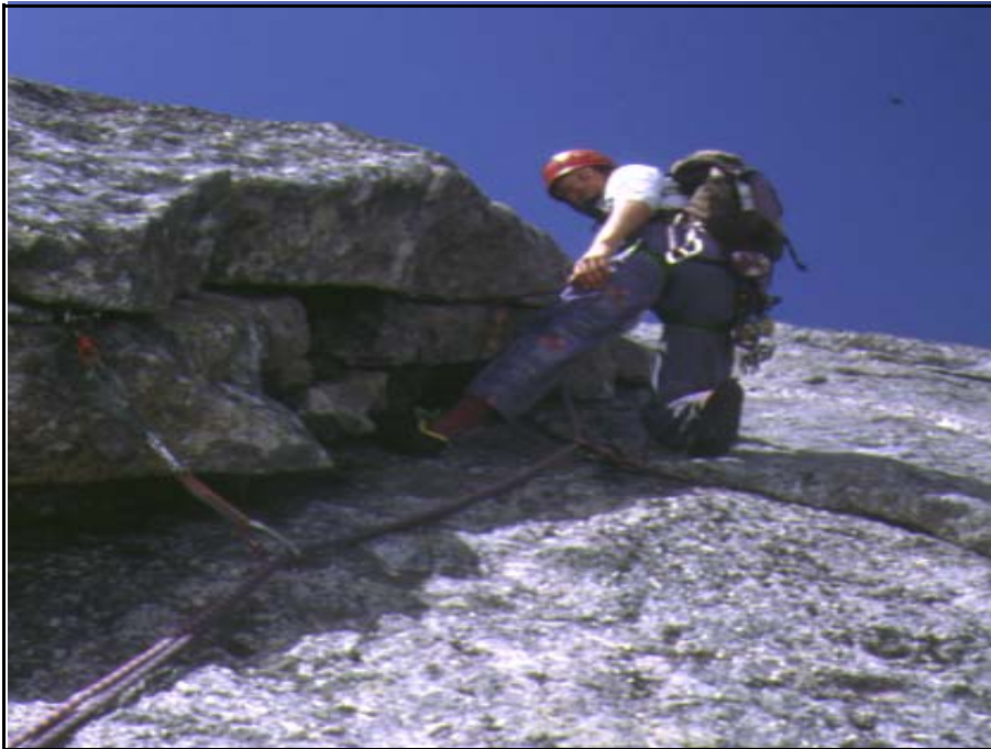
Sfinge - via Dino Fiorelli corso 1998