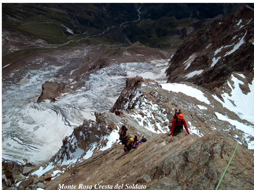
Monte Rosa Cresta del Soldato

Tutti gli allievi sono invitati a partecipare alle serate culturali organizzate dalla Sezione, in particolare durante il periodo di svolgimento del Corso.