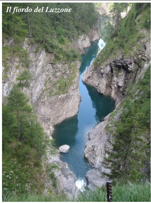
Il fiordo del Luzzone