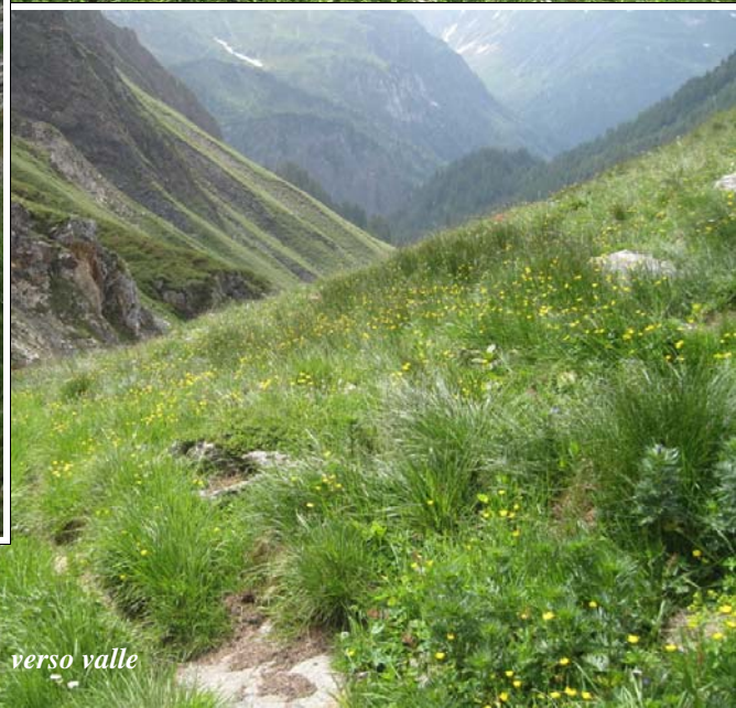
Dalla testata verso valle