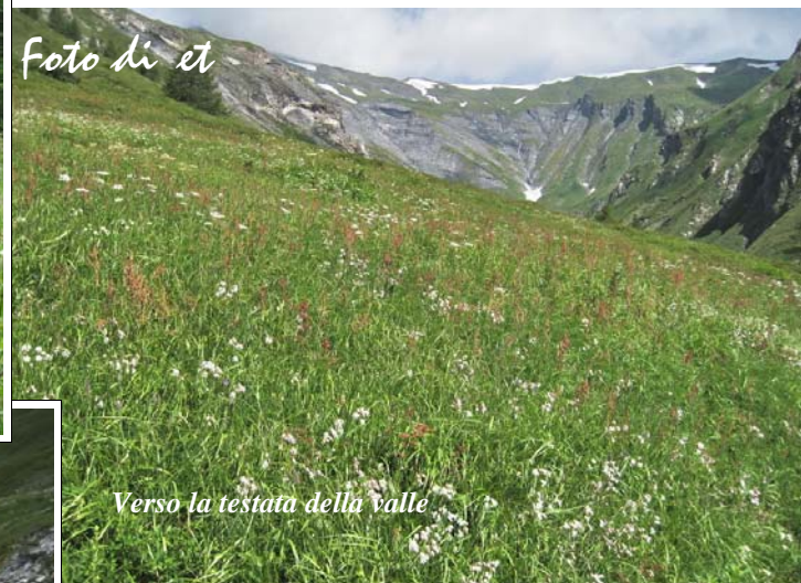
Verso la testata della valle