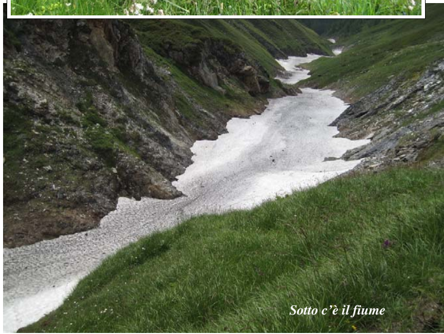
Sotto c'è il fiume