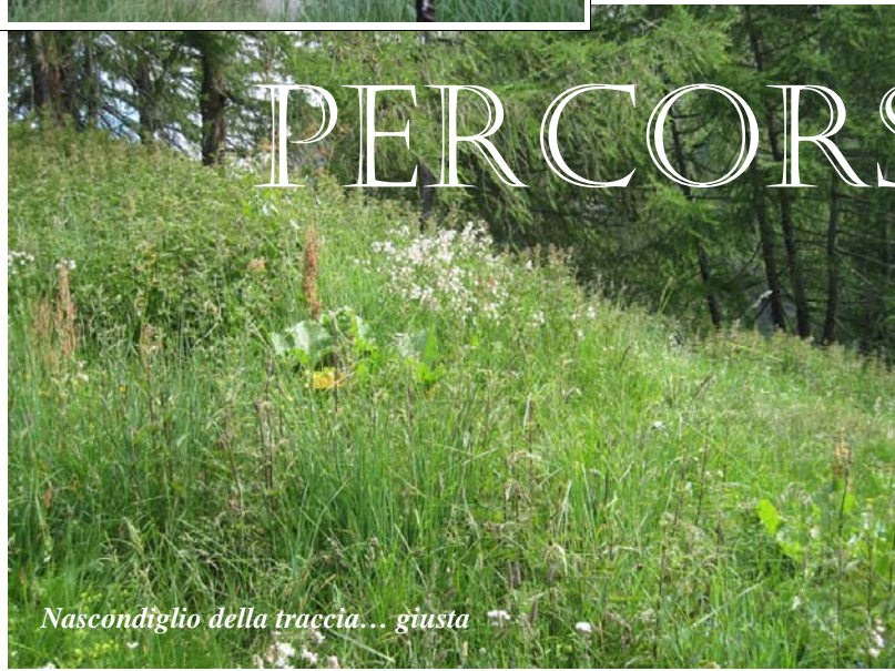
Nascondiglio della traccia... giusta