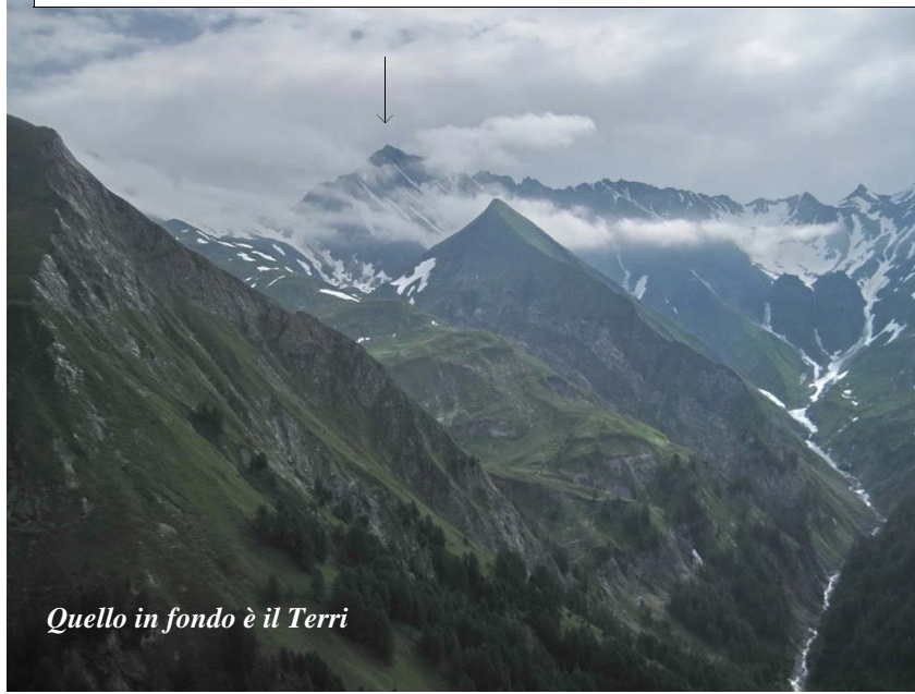
Quello in fondo è il Terri