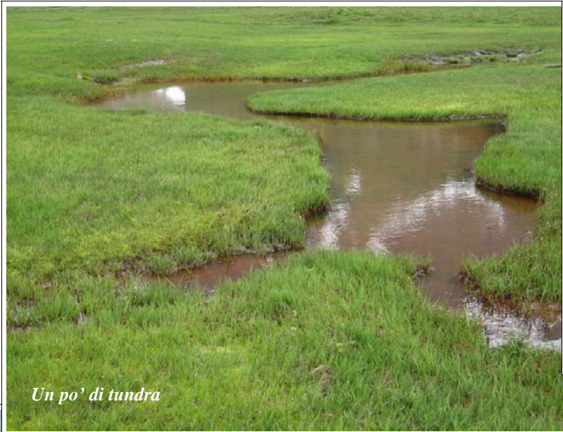
Un po' di tundra