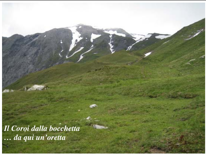
Il Coroi dalla bocchetta ... da qui un'oretta