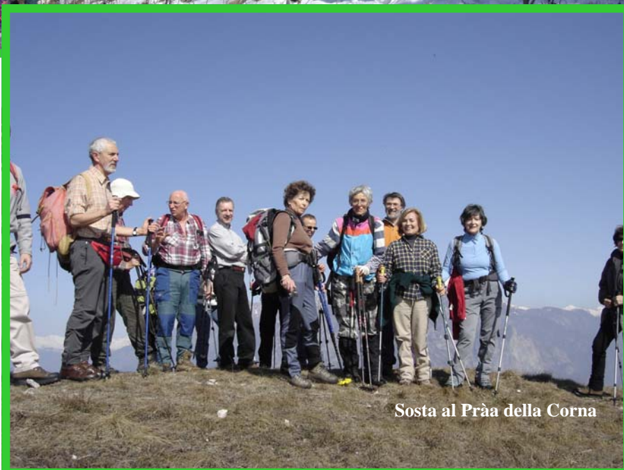
Sosta al Pràa della Corna