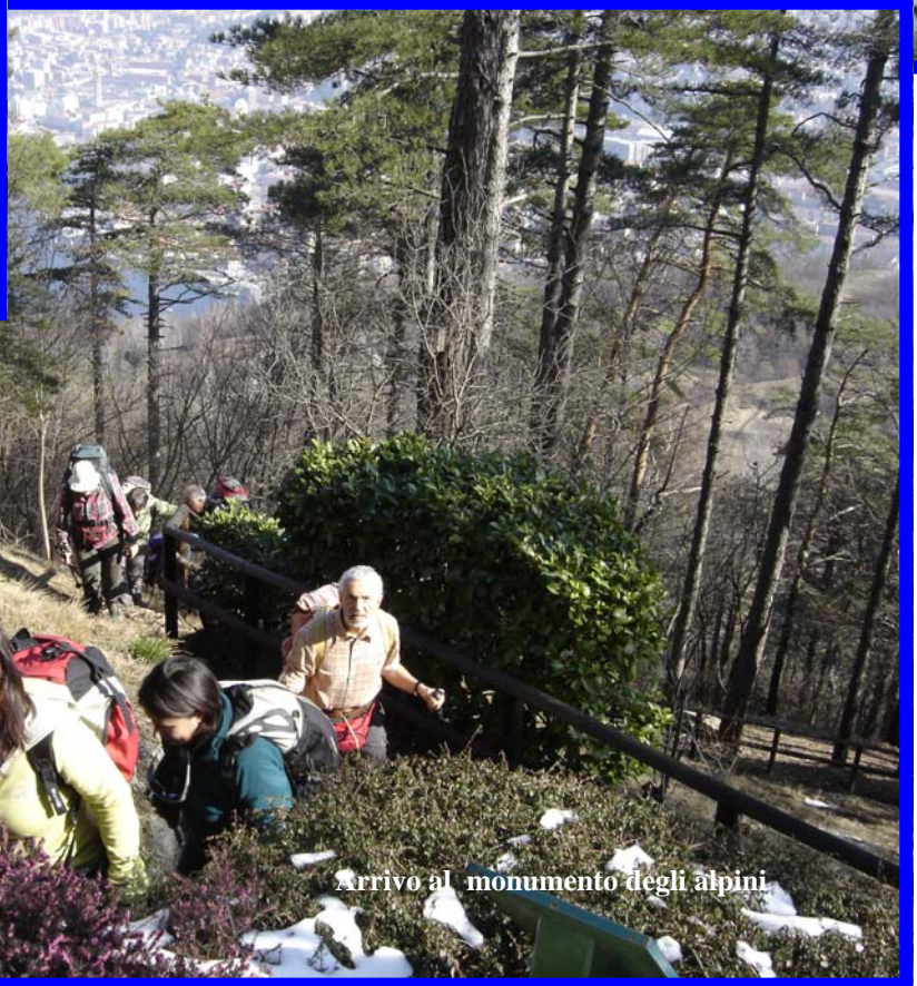
Arrivo al monumento degli alpini