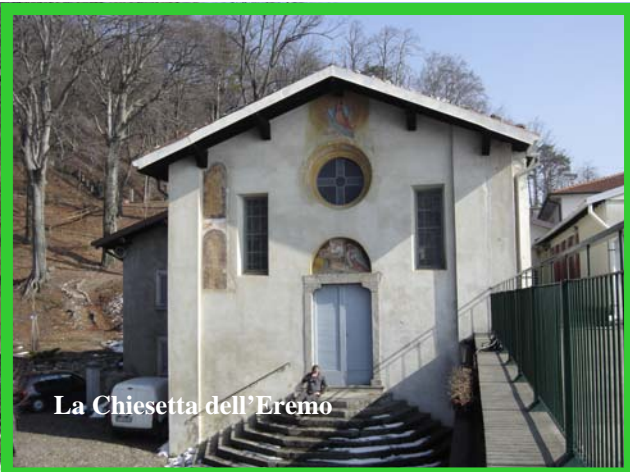
La Chiesetta dell'Eremo