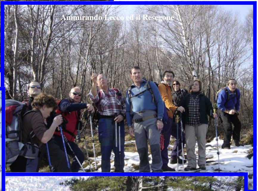
Ammirando Lecco ed il Resegone