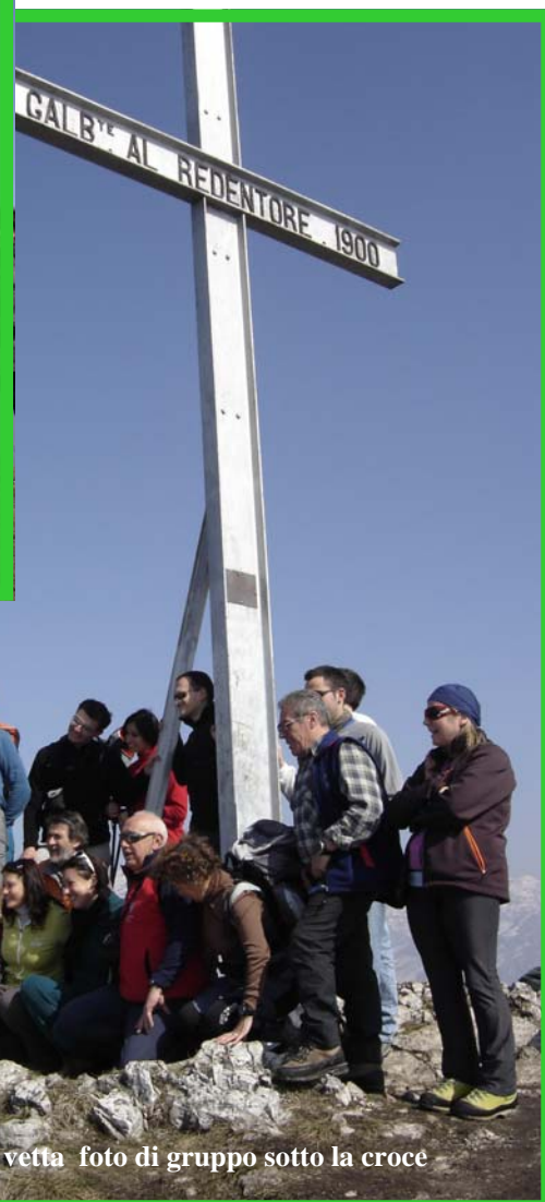
In vetta foto di gruppo sotto la croce