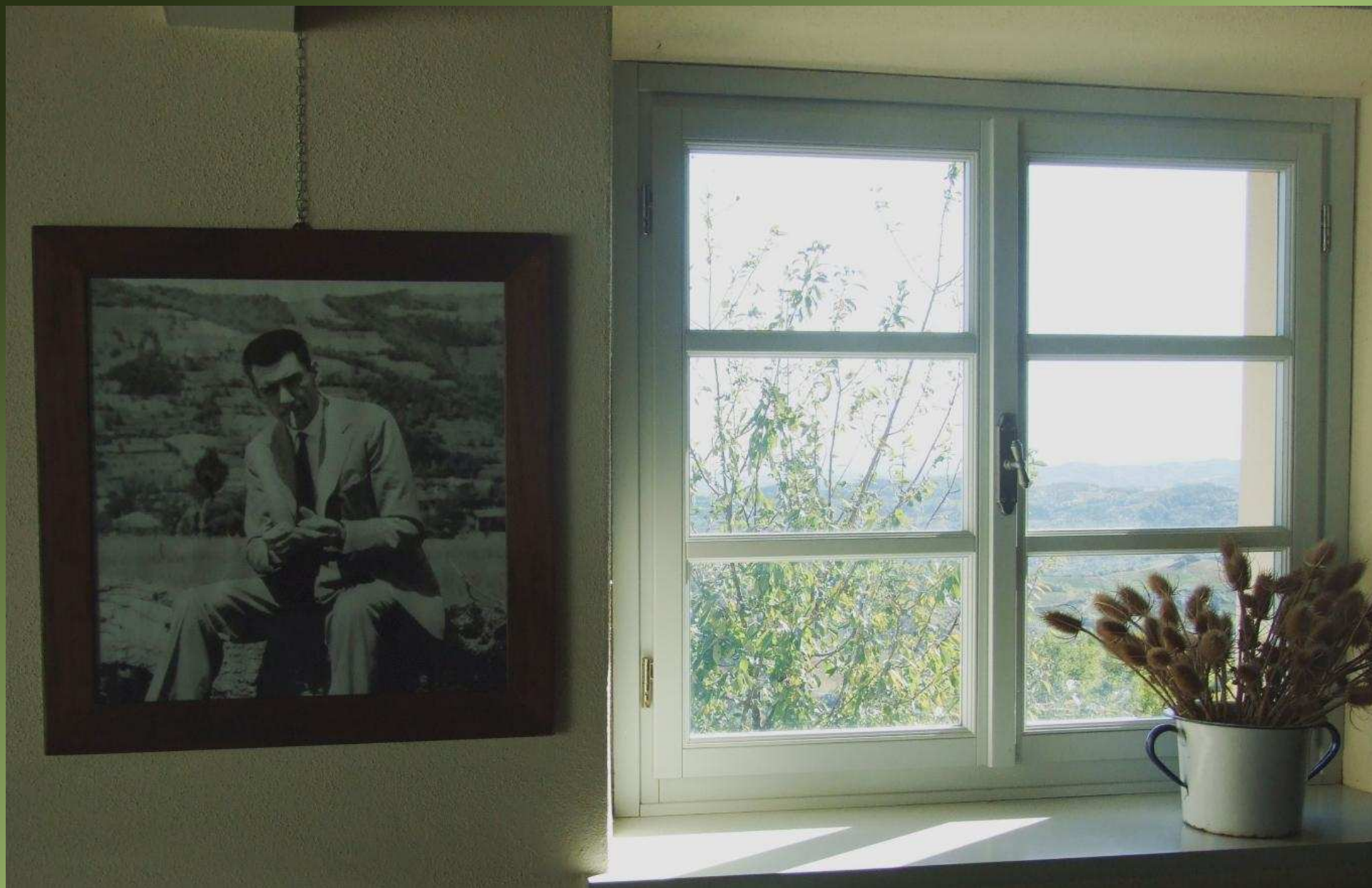
Beppe Fenoglio – Foto alla cascina Pavaglione