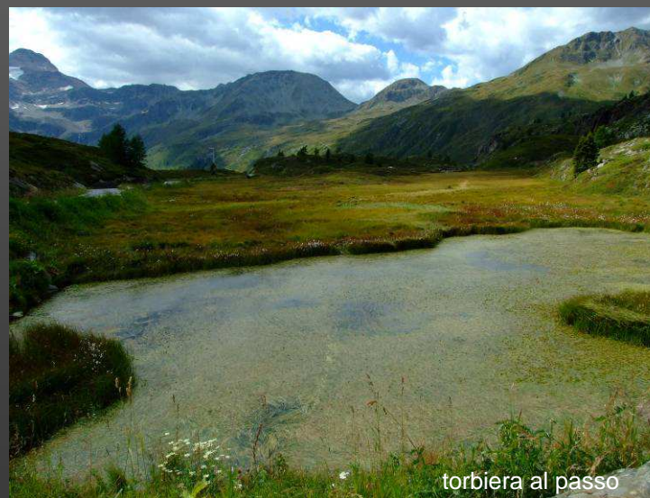
torbiera al passo