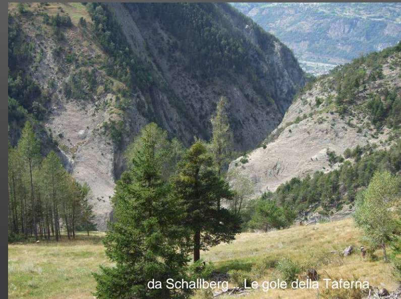
da Schallberg - Le gole della Taferna

Dopo la sosta valuteremo se proseguire la discesa in direzione nord, fino alle gole della Taferna - località Grund (m. 1071), dove però dovremo risalire per più di un centinaio di metri fino a Schallberg (m.1316), oppure ritornare a Simplondorf per una visita al villaggio. Nel primo caso il tempo di percorrenza sarà di circa ore 2-2,30, nel secondo il tempo di percorrenza sarà più breve!