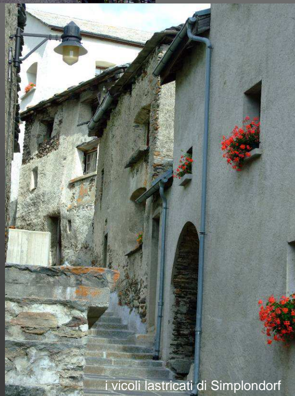
i vicoli lastricati di Simplondorf

Lo Stockalperweg prende avvio da Gondo e risale le omonime gole fino all'Alte Kaserne. Il percorso in quel primo tratto si è rivelato abbastanza monotono, motivo per cui a ottobre l'escursione prenderà avvio proprio dall'Alte Kaserne (m. 1157), la vecchia caserma napoleonica edificata intorno al 1805 durante i lavori di costruzione della strada militare. In seguito l'edificio è stato utilizzato come deposito cantoniere e solo negli ultimi anni è stato oggetto di ristrutturazione e destinato ad ospitar il museo della storia dei trasporti su strada del Sempione. Dopo una breve visita attraverseremo il Doveria su un magnifico ponte per proseguire sulla sponda orografica dx del fiume in direzione Gabi (m. 1228) dove, in corrispondenza dell'imbocco della Laggintal, lo riattraverseremo per risalire in direzione prima nord poi est-nord-est i ripidi pendii di Chastelberg fino all'abitato di Simplondorf (m. 1472 ore 1-1,30)