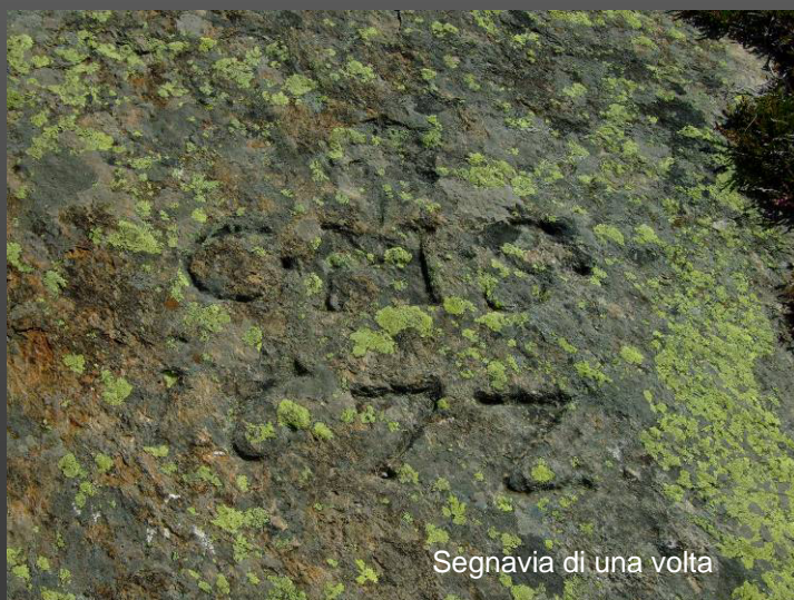
Segnavia di una volta

Eccoci finalmente in vista dell'Alter Spittel (m. 1866) risalente al 1325, mentre più sotto si allunga l'imponente struttura del vecchio ospizio e alle nostre spalle si stagliano i 4000 Fletschorn e Lagginhorn. In breve raggiungeremo il valico del Sempione (m. 2009 ore 3,30-4), caratterizzato da alpeggi con collinette rotonde, piccole paludi, torbiere alte, pascoli alpini e terreni privati circondati da muretti.