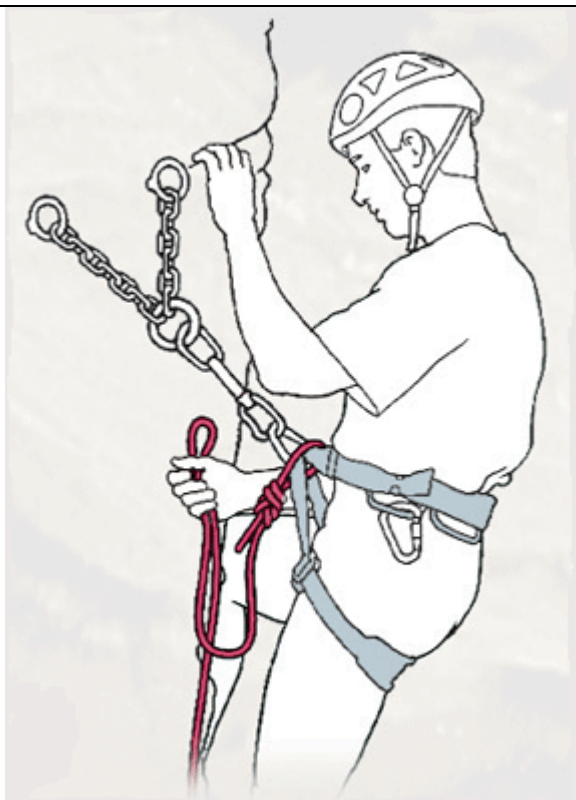
Figura 1: auto-assicurazione con cordino oppure con rinvio dotato di moschettoni a ghiera