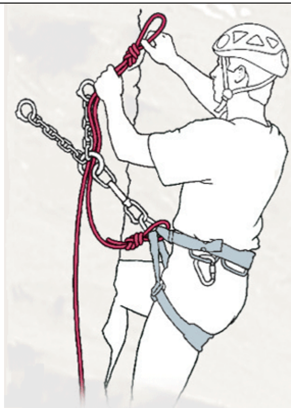
Figura 2: creazione di asola semplice