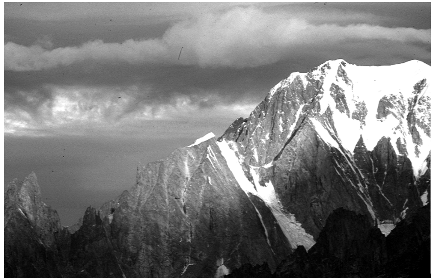
Un'alba fortunata... dalla Testa Bernarda

La discesa si svolge sul versante opposto, su pendii nevosi che portano