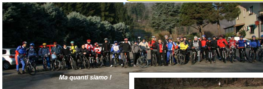
Ma quanti siamo !

Per vedere il resto delle foto, leggere i commenti completi e avere notizie sul programma completo del nostro gruppo vi rimandiamo al nostro forum: